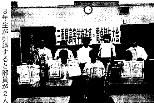
3年生が引退すると部員が2人

私たち放送部は現在、2年生8人で活動しています。主な活動内容は、お昼休みに校内放送で音楽を流したり、壮行会をはじめ、学校行事での司会などを行っています。今年からは、積極的に放送部のセミナーや大会にも参加しています。 昨年度、3年生が卒業されたことで現在は2年生のみの活動ですが、一つ一つ精一杯取り組んでいます。まだまだ未熟ではありますが、みんな力を合わせて、より様々な活動に励みたいと思います。