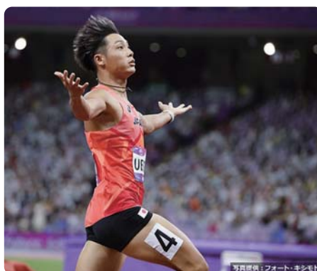
200m決勝のゴールラインを駆け抜けて

山商卒業生、上山紘輝選手が、陸上男子200mで見事金メダル、4×100mリレーでも銀メダルを獲得しました。来年のパリオリンピックでも、ぜひ上山選手の勇姿をみたいものです。