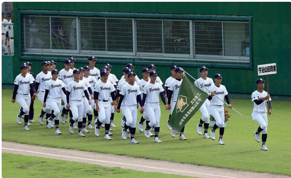
第105回全国高等学校野球選手権記念三重大会 開会式にて