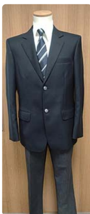
●ブレザー・スラックス型 (A・B、二つのタイプあり)