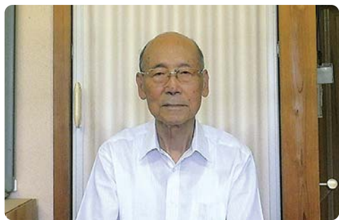
山田奉行所記念館・事務所にて

このとき、村長は「御菌らしき発見事業」の一つとして、山田奉行所の取り上げ方を考えていた。一方、村教育委員会の考え方は、山田奉行所を含めた歴史資料館を建設しようというものであった。しかし、私は伊勢市との合併が具