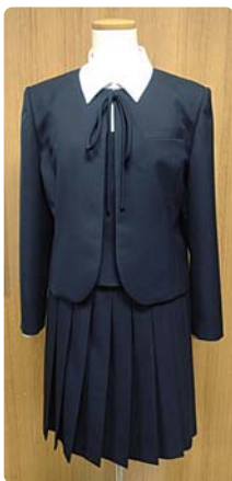
●ボレロ・スカート型

現在、多くの学校で採用されているブレザー・スラックス型と、従来型に近いボレロ・スカート型が用意されています。