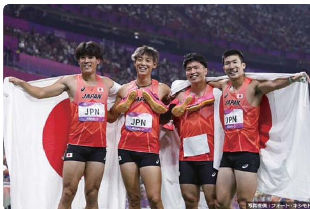
4×100mリレーメンバーと